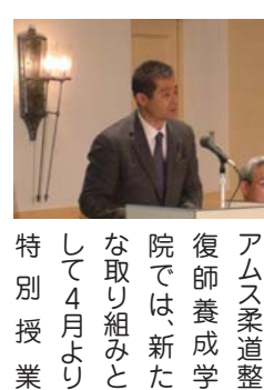
アムス柔道整復師養成学院では、新たな取り組みとして4月より特別授業として4月より「アムス特別講座」を開講いたします。これに先駆け平成22年1月16日、「アムス特別講座」説明会をシティープラザ大阪（93名）と、当学院（45名）にて開催いたしました。これからの柔道整復師は、基本治療である外傷施術（脱臼・捻挫・打撲など）だけでなく、高齢者特有の症状や過度の運動によるスポーツ障害、さらには運動指導等による傷害の予防や損傷後のケアに至るまで幅広いニーズが求められ、役割も多様化していくと考えます。

アムス特別講座」を開講いたします。これに先駆け平成22年1月16日、「アムス特別講座」説明会をシティープラザ大阪（93名）と、当学院（45名）にて開催いたしました。これからの柔道整復師は、基本治療である外傷施術（脱臼・捻挫・打撲など）だけでなく、高齢者特有の症状や過度の運動によるスポーツ障害、さらには運動指導等による傷害の予防や損傷後のケアに至るまで幅広いニーズが求められ、役割も多様化していくと考えます。